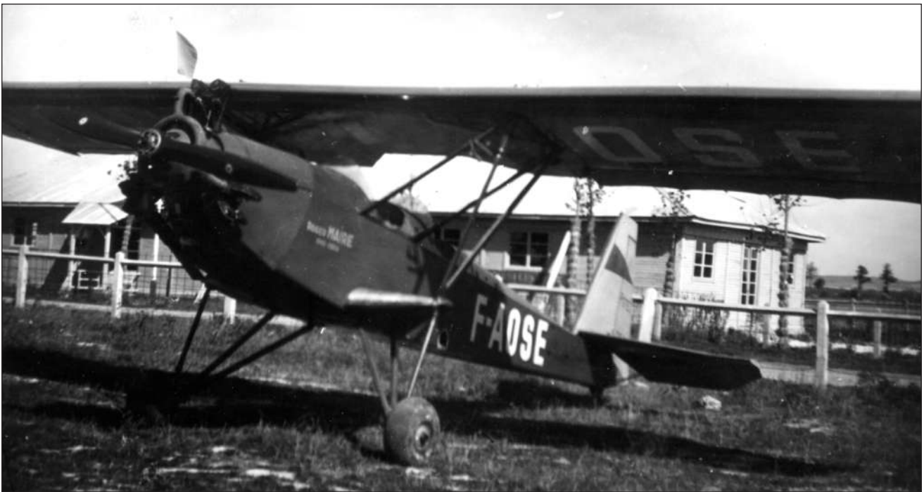
Above: Potez 600 Sauterelle F-AOSE, one of a large batch built in 1936-37, on a visit to Toussus-le-Noble.