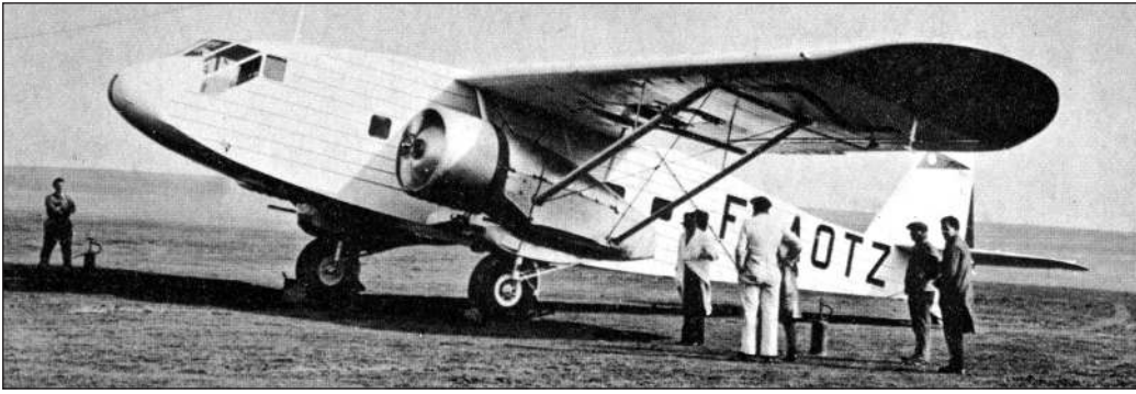
Left: Potez 620 F-AOTZ was operated by the government as a ministerial transport in an all-white colour scheme except for the nacelles.