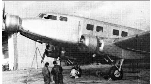
Below: The Bloch 300 prototype F-AOUI, formerly F-AONB, was commonly known as "La Grosse Julie".

5407 F-AOUI Bloch 300 01 Ex F-AONB . Etat Français (5.10.37); loan Cie Air France; named "La Pacifique". Possibly used by Spanish Republicans (perhaps on loan).