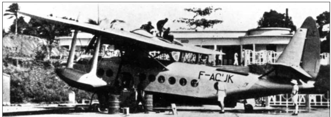
Right: F-AOUK was one of three Sikorsky S.43 amphibians operated by Aéromaritime in West Africa. It is seen here being refuelled on the ramp at Abidjan.